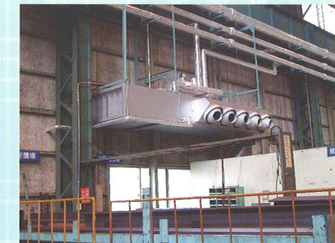
大型ファンコイルユニット