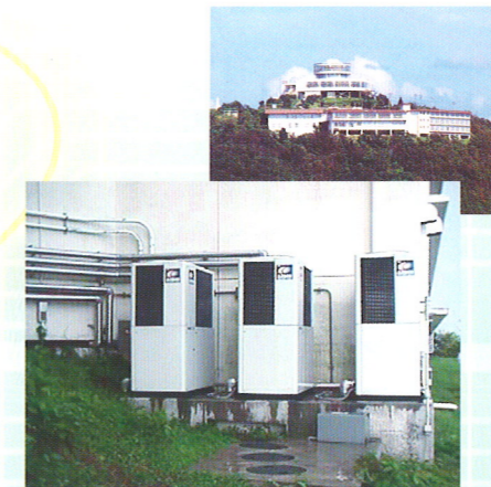
アイシン健康保険組合 三ヶ根山荘 全館空調・換気工事